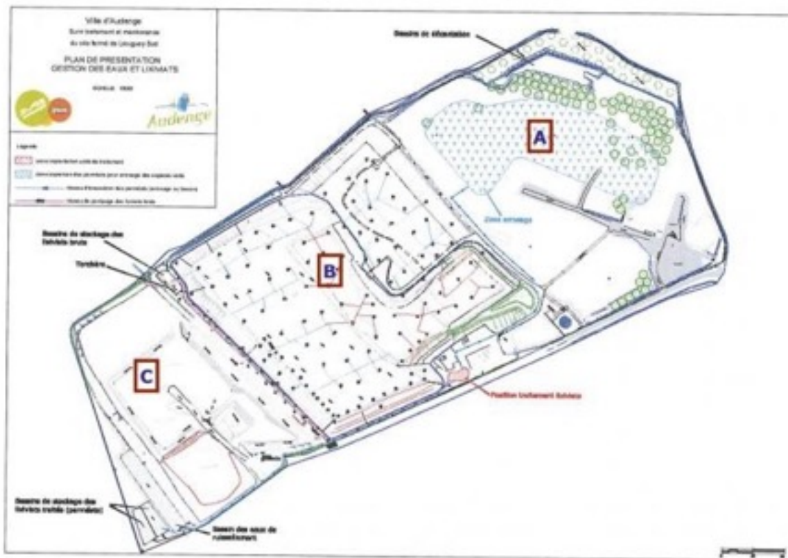
Figure 2 : Plan de gestion des eaux et des lixiviateurs