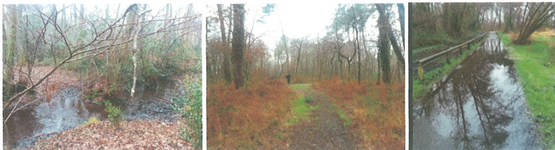
Photo 1 zone humide