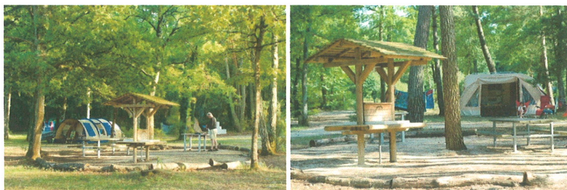
Exemples d'aires bivouacs – Huttopia Rillé (Touraine)

Les aires bivouacs sont des installations très sommaires destinées aux campeurs qui n'ont pas d'eau sur leur emplacement. Ils y font leur vaisselle dans des éviers installés sur une structure bois surmontée d'une toiture. Une table en bois de type picnic est installée pour rendre l'espace convivial. L'espace est sécurisé. Il comprend les dispositifs de RIA pour la lutte contre les incendies.